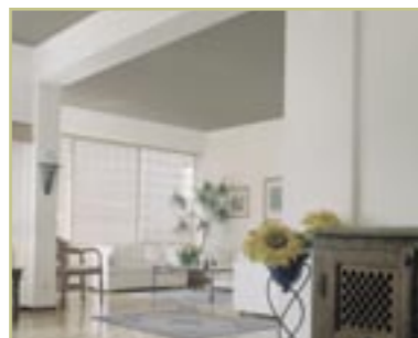
Eksempel t.v. med lyse lofter og t.h. med mørke lofter.